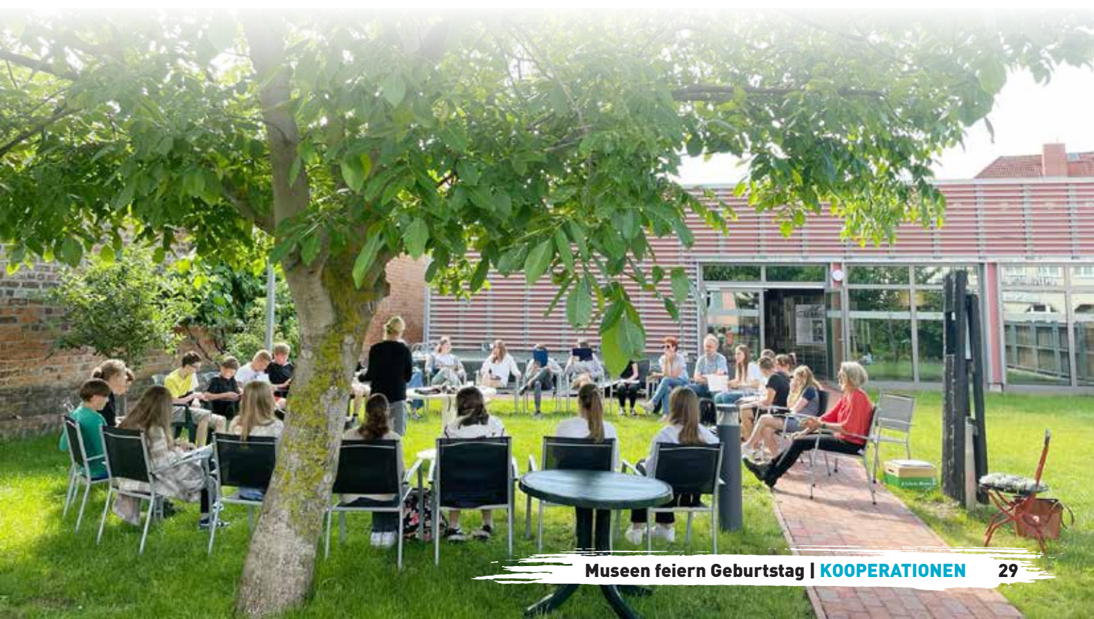
Projektarbeit mit Jugendlichen im Jüdischen Museum

bis 2010 saniert. Es ist die einzig erhaltene historische Mikwe im Land Brandenburg. Die Bildungsarbeit der Museen hat auch in diesem Museum einen festen Platz. Im letzten Schuljahr 2023/2024 waren allein im Jüdischen Museum 638 Schüler an 23 Projekttagen im Haus. Ins Jüdische Museum locken von Mai bis September auch Konzerte und andere kulturelle Veranstaltungen in den grünen Gartenraum.