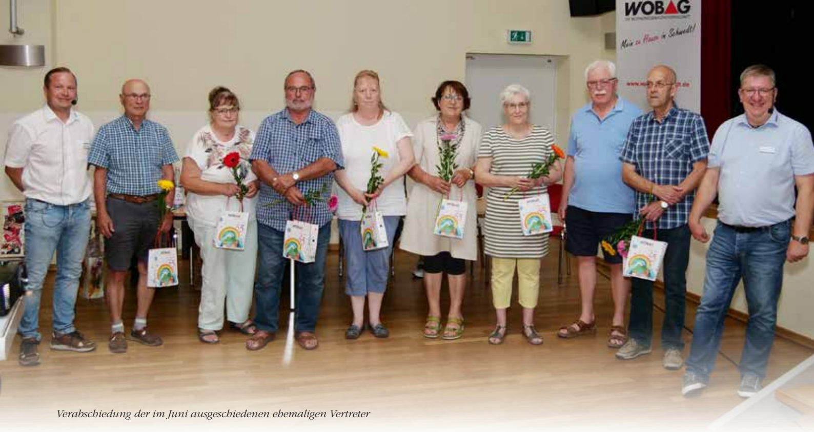
Verabschiedung der im Juni geschiedenen ehemaligen Vertreter