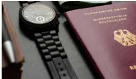
Wer verreisen möchte, sollte rechtzeitig seine Reisedokumente prüfen.

im Expressverfahren oder vorläufige Dokumente erstellt werden. Diese Mehrkosten müssen jedoch nicht sein, wenn man sich rechtzeitig kümmert. WICHTIG: Informieren Sie sich vorher, was zum Termin mitzubringen ist (z. B. Personalausweis, aktuelles Passbild etc.)