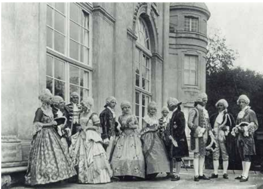
Die feierliche Eröffnung des Schwedter Museums fand 1930 im Rittersaal des Schlosses statt. Die Aufnahme zeigt Beteiligte in Rokokokostüme aus der Markgrafenzeit.

Mit Fördermitteln der Europäischen Union, des Landes Brandenburg und des Landkreises Uckermark wurde zwischen 1998 und 2000 aus einer Tabakscheune das Tabakmuseum Vierraden. Zum saisonal geöffneten Spezialmuseum gehört ein Garten mit Schaubeeeten und interessanten landwirtschaftlichen Maschinen und Geräte, die das ländliche Leben und Arbeiten dokumentieren. Bei der gemeinsamen Projekt- und Vermittlungsarbeit greifen viele Kooperationspartner ineinander. Besonders die