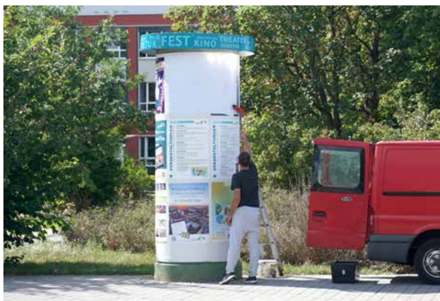
Um für eine Veranstaltung zu werben, bietet die Stadt eine kostenlose Veröffentlichung im Internet, im Stadtjournal und an der Kultursäule an.