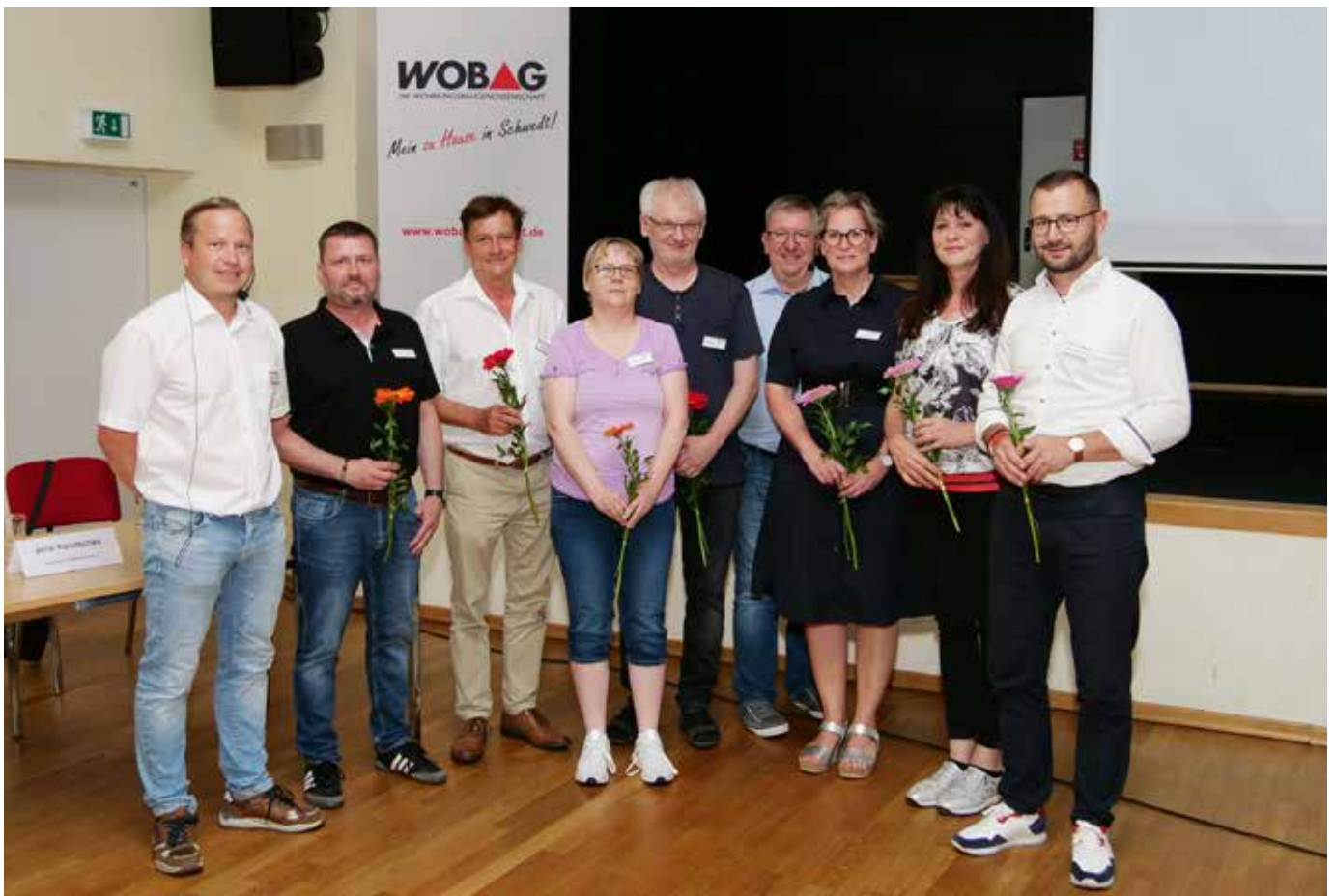
Der im Juni 2024 neu gewählte Aufsichtsrat